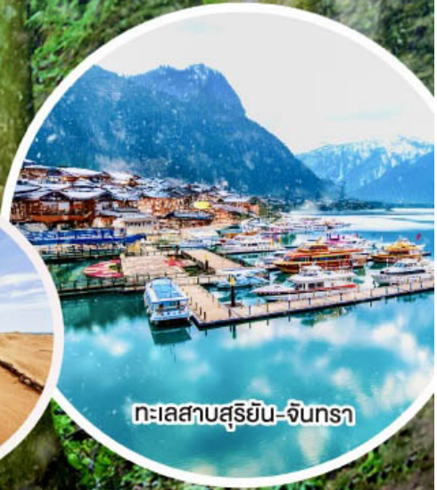
ทะเลสาบสุริยัน-จินกรา