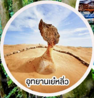
อุทยานเย่หลิว