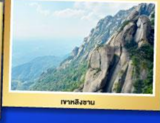
เขาหลิงซาน