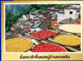
นั่งกระเช้าขึ้นชมหมู่บ้านหวงหลิง