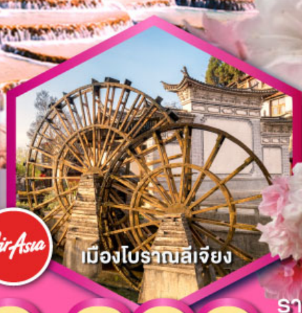
เมืองโบราณลีเจียง