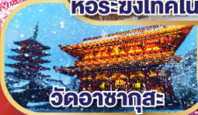
วดอชาทุสะ