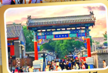
ถนนโบราณหนานหลวู่กุ่เซียง