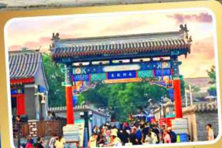
ถนนโบราณหนานหลิวคู่เซียง