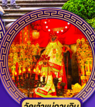
วัดเจ้าแม่กวนอิม ฮองฮ่า