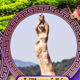
จูไห่พิงเซอร์เกิร์ส