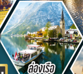
ล่องเรือ ทะเลสาบอัลสติก