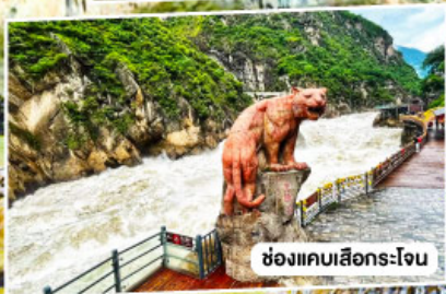
ช่องแคบเลือกระใจ