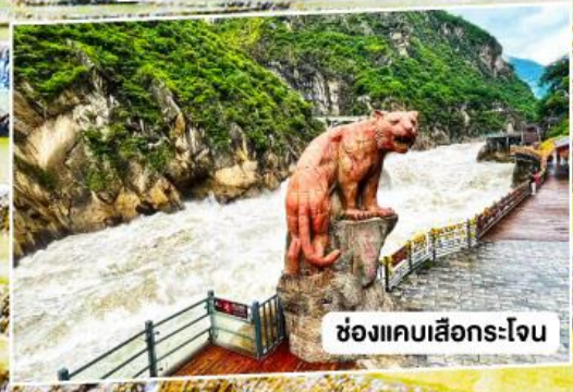
ช่องแคบลีโกระโจน