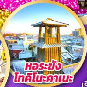
หอรบั้งโทคิโนะคานะ