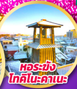
หอรบั้ง โทคิโนะคานะ