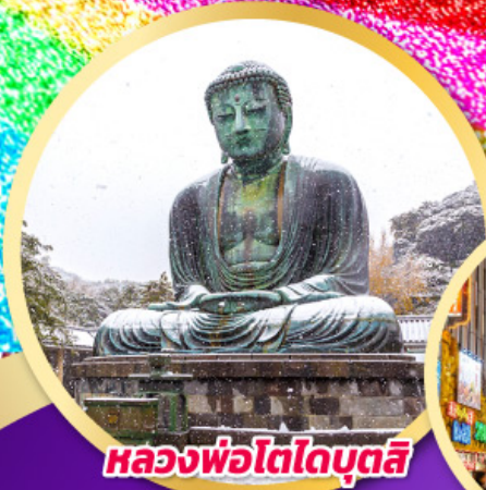
หลวงพ่อโตโดบุตสึ