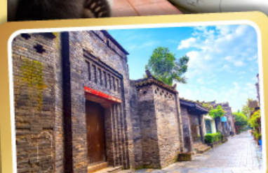
ถนนคนเดินชอยกว้างชวยแคบ