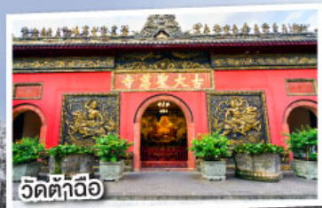
วัดต้าถื่อ