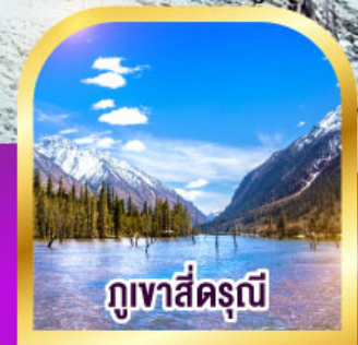
ภูเขาสี่ฤดู