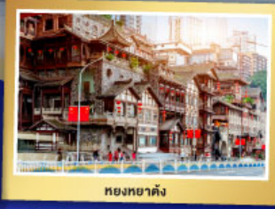
หอยหยาดิ่ง