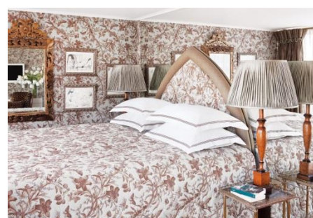
SUITE (SU) Luxurious riverview stateroom with open-air balcony | (27.3 SQ.M.)