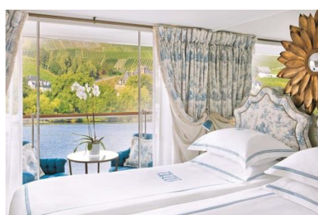
DELUXE BALCONY (DB) Luxurious riverview stateroom with open-air balcony | (18.2 SQ.M.)