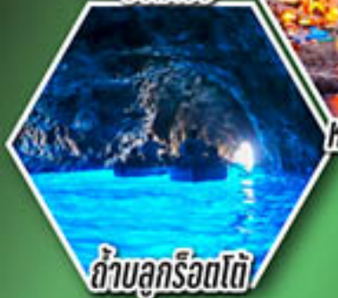
ถ้ำลูกรोटโต้