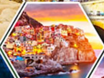
หมู่บ้านมาราโรลา