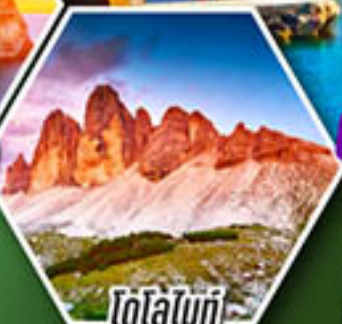
โดโลไมท์

โปรแกรมเดียว เก็บครบจบ อิตาลี ตั้งแต่เหนือถึงใต้