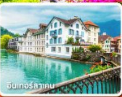
อินเทอร์ลาเกน

พักค้างคืนมิลาน 2 คืน ซูริก 2 คืน ไม่ต้องเปลี่ยนโรงแรมบ่อย