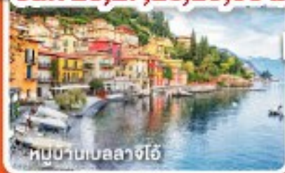
หมู่บ้านเบลลาจีโอ