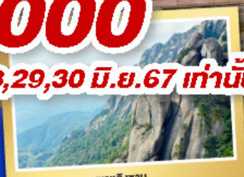
เทาลิ่งซาน