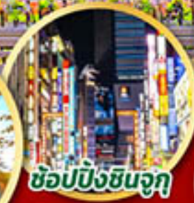
ซ้อปบึงชินจูกุ