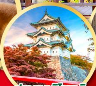
ปราสาทอิโรซากิ