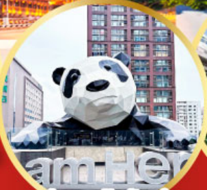
หมีแพนด้าป็นตึก