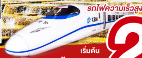
เริ่มต้น