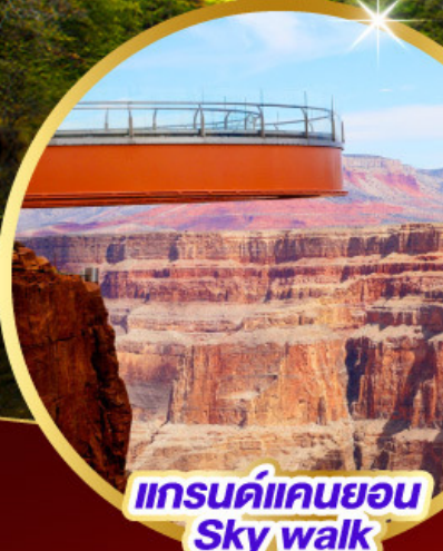
แกรนด์แคนยอน Sky walk