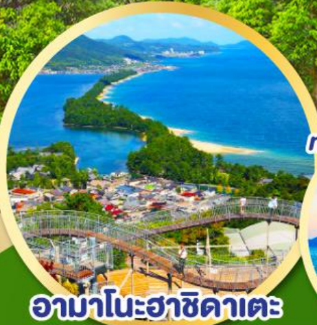
อามาโนะฮาซิดาเตะ