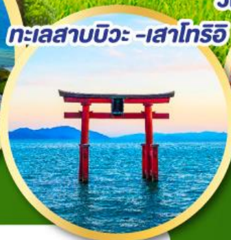
ทะเลสาบบิวะ -เสาโทริอิ