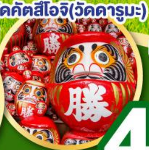
วัดคิตสึโอจิ(วัดदारุมะ)

เที่ยวเต็มทุกวันนี้ไม่มีฟรีดิย์ เริ่มต้น