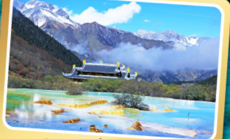
อุทยานแห่งชาติหลงหล่ง