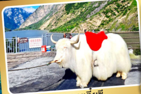
ทะเลสาบเตี้ยซี