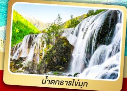
น้ำตกธารไ่บุ๊ก