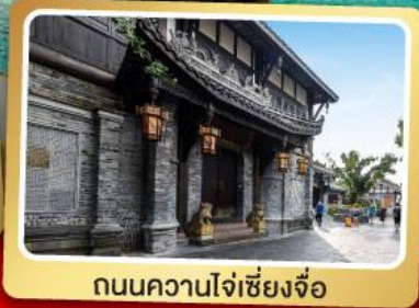
ถนนความใจ๋เซียงจื่อ