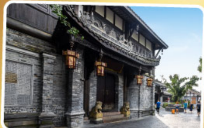
ถนนความใจ๋เซียงจื่อ