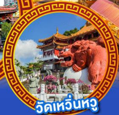
วัดเหวี่ยนหู่