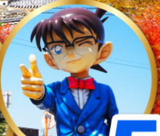
โคนันทาวน์