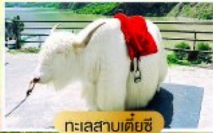
ทะเลสาบเต๋ยซี