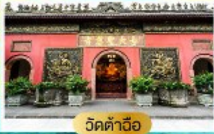
วัดต้าอ้อ