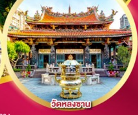
วัดหลงชาน