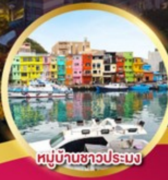
หมู่บ้านชาวประมง