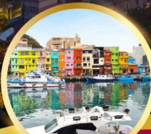
หมู่บ้านชาวประมง