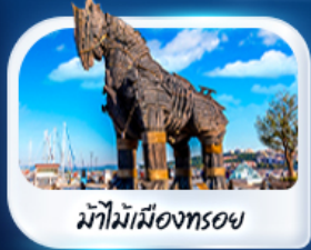
ม้าไม้เมืองทรอย

6-14 ก.พ.68 / 20-28 ก.พ.68 / 11-19 มี.ค.68