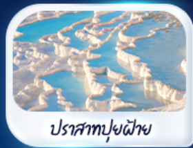
ปราสาทปูยฝาย