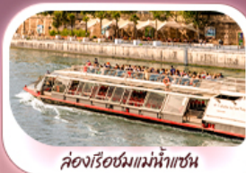
ล่องเรือชมแม่น้ำแซน