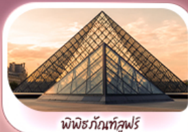
พีพริสกันท์คูฟร์