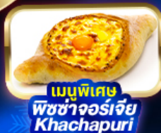
เมนูพิเศษ พิซซ่าจอร์เจีย Khachapuri