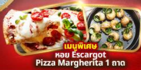
เมนูพิเศษ หอย Escargot Pizza Margherita 1 ถาด

แถมฟรี! น้ำดื่ม 1 ขวดทุกวัน, ปลั๊กไฟยูนิเวอร์แซล