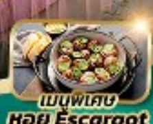
เมนูพิเศษ หอย Escargot