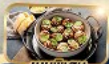
เมนูพิเศษ หอย Escargot