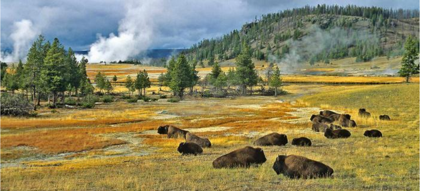
ใกล้เคียง

วันที่ห้าของการเดินทาง(5) เวสต์ เอลโล่ สโตน - อุทยานแห่งชาติแกรนด์ทีทอน เชียนบัฟฟาโล่ บิลด์ - เมืองโคดี้