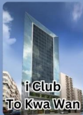
i Club To Kwa Wan

คอนเฟิร์มเดินทาง พฤศจิกายน 2567 2-4 / 9-11 / 16-18 23-25 / 30 พ.ย. - 2 ธ.ค.