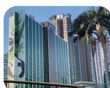
Panda Hotel (ซุนหวาน)