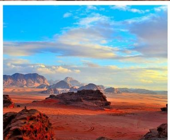
ทะเลทรายวาดี รัม