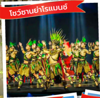
โชว์ชาวย่าโรแมนซ์