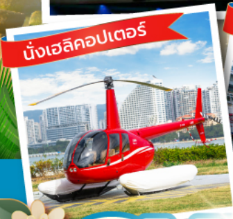
นั่งเฮลิคอปเตอร์