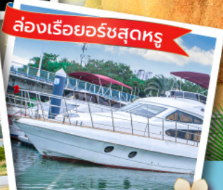
ล่องเรือยอร์ชสุดหรู