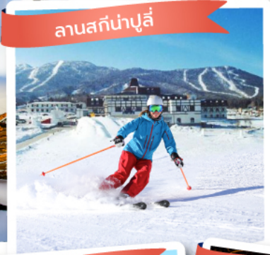
ลานสกีน้ำปู๋ลี่