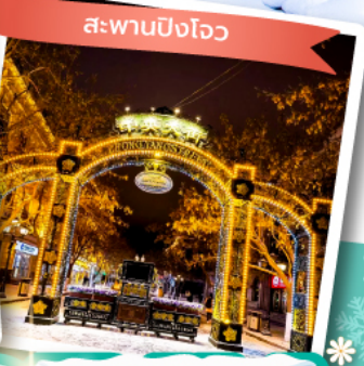
สะพานปิงโหว