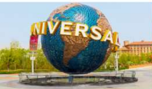
สวนสนุกยูนิเวอร์เซลปักกิ่ง รีสอร์ท