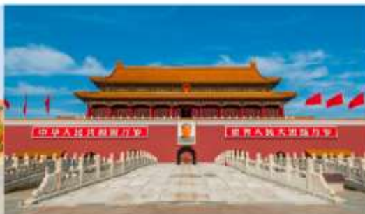
พระราชวังต้องห้ามปักกิ่ง