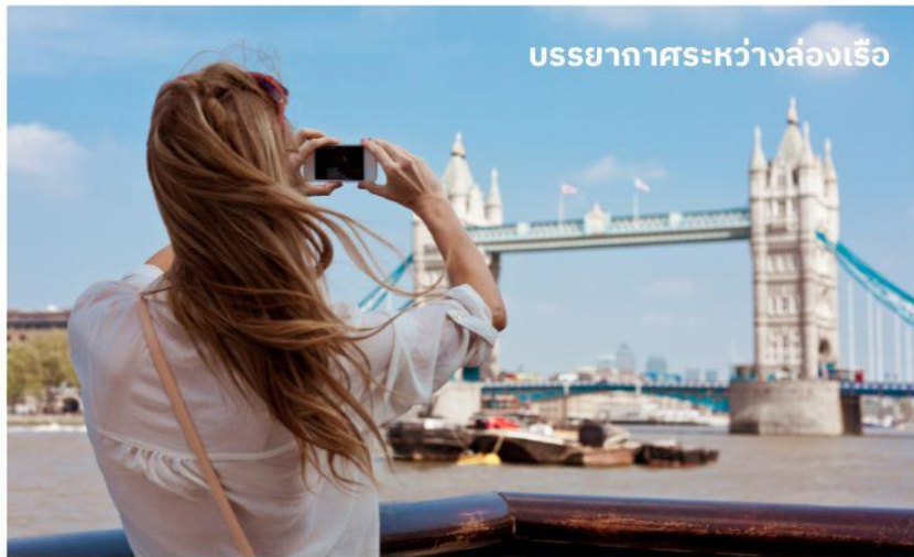
บรรยากาศระหว่างล่องเรือ

ชมทิวทัศน์งดงามของสองฝากฝั่งแม่น้ำเทมส์ ซึ่งไหลผ่านกลางกรุงลอนดอน ล่องเรือผ่านสถานที่สำคัญต่างๆ เช่น จัตุรัสรัฐสภา, พระราชวังเวสต์มินสเตอร์, ลอนดอนอาย, ทาวเวอร์ออฟลอนดอน และ ทาวเวอร์บริดจ์