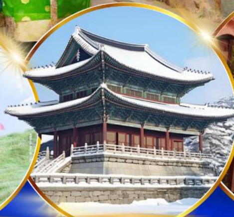
พระราชวังเคียงบกคยอง