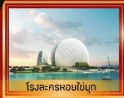
โรงละครหอยโข่มุก