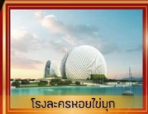
โรงละครหอยไข่มุก