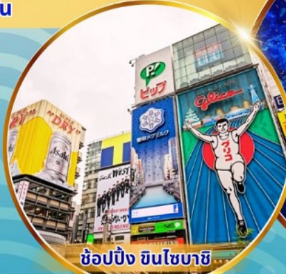
ช้อปปิ้ง ชินโซบาชิ