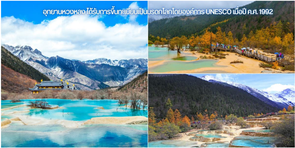
อุทยานหวงหลง ได้รับการขึ้นทะเบียนเป็นมรดกโลกโดยองค์การ UNESCO เมื่อปี ค.ศ. 1992

URGENT! เส้นทางนี้...เดินทางสู่พื้นที่สูงมากกว่า 2,500 เมตรจากระดับน้ำทะเล เนื่องจากมีความดันอากาศและออกซิเจนลดลง อาจจะทำให้เกิดอาการแพ้ที่ราบสูงได้ หากมีอาการกรุณารีบแจ้งไกด์หรือหัวหน้าทัวร์