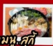
เมนู-สุกี้

สุสานทหารดินเผาจีนซี ถ้ำหลงเหมิน ถนนวัฒนธรรมราชวงศ์ถัง ถนนคนเดินประตูโบราณลี่จินเหมิน กำแพงเมืองโบราณ ร้านPOP MART วัดเส้าหลิน ป่าเจดีย์ ชมการแสดงกังฟู