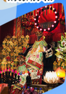
เจ้าแม่กวนอิมซี่มเงิน