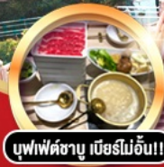
บุฟเฟ่ต์ชาบู เนิร์โมอัน!!