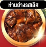
हांอย่างรสเลิศ