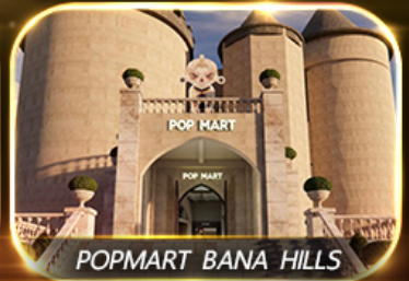
POP MART BANA HILLS

สัมผัสความงามหมู่บ้านฝรั่งเศสที่บานาฮิลล์ ซอปปิง POPMART